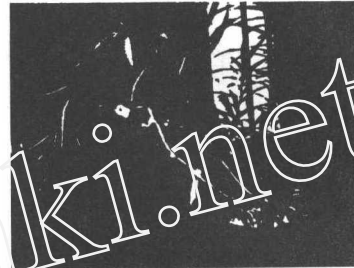
图2 实验2 在体树枝恒弯曲受力过程测量

沙逐渐加重而对胫骨加压,脚上逐渐负重而使胫骨拉伸,以及悬脚或鸡胸卧地而让胫骨不受力等等措施,比较鸡在正常生长状态下的胫骨轴向生长和径向加粗,从而比较全面地了解骨的生长规律。我们将定量地探索拉应力有利于骨的轴向生长而径向变细,压应力阻碍骨的轴向生长而径向加粗的可能性。