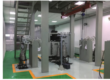
图 1 AiBCS 校准系统照片

AiBCS 设计载荷指标充分考虑了多个因素, 如高超飞行器升阻比特点、激波风洞流场起动特点 [11] 等。AiBCS 校准精度指标优于 0.05%F.S., 可实现最大法向力 \pm 15 kN 量程范围的脉冲型天平的高精确度“一键式”全自动校准 [10] 。